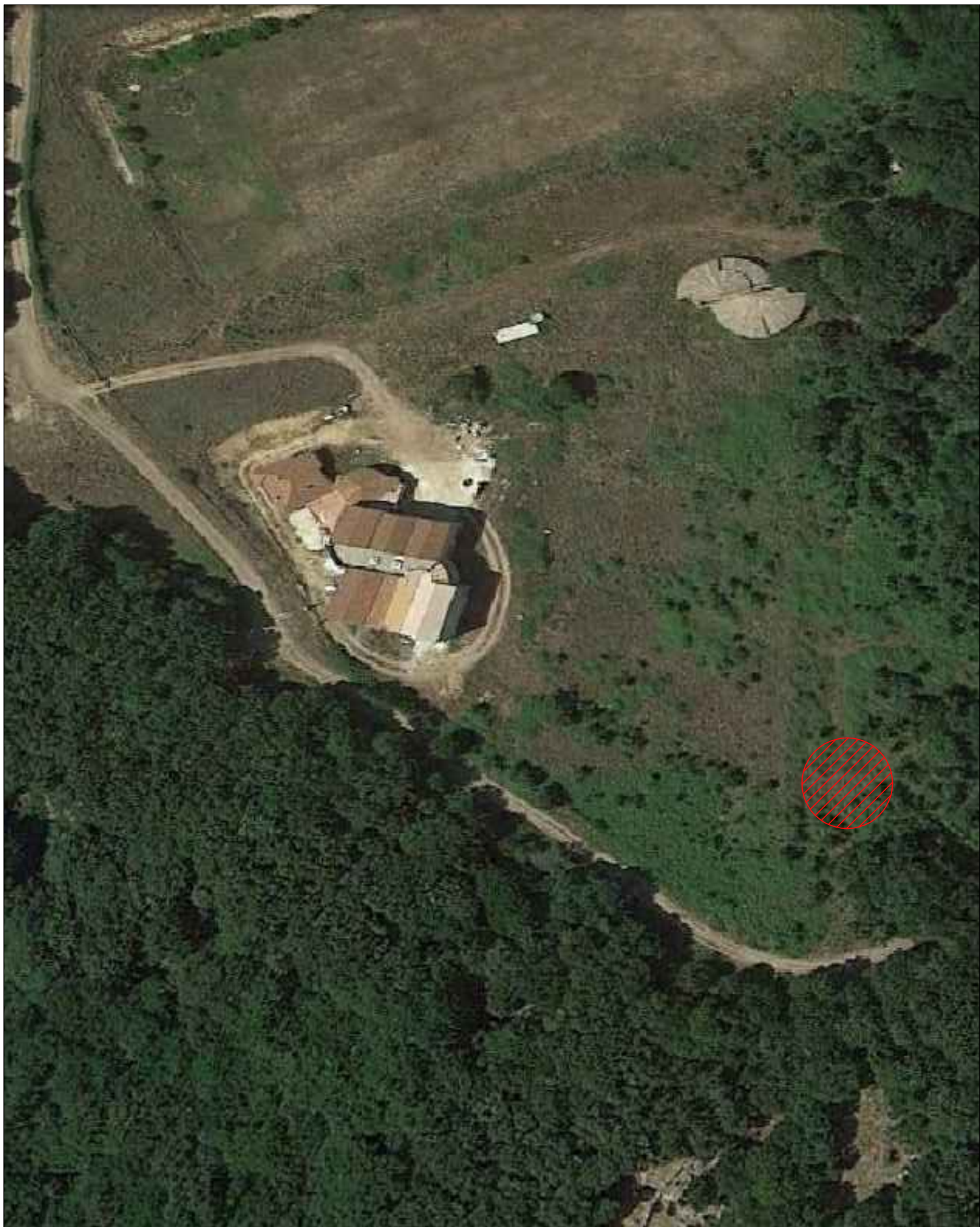
VISTA AEROFOTOGRAMMETRICA Scala 1:1000